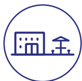
Beherbergung und Gastronomie