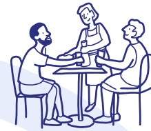
Beherbergung und Gastronomie